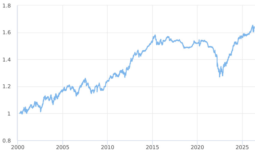
— Amundi CR Dluhopisový PLUS