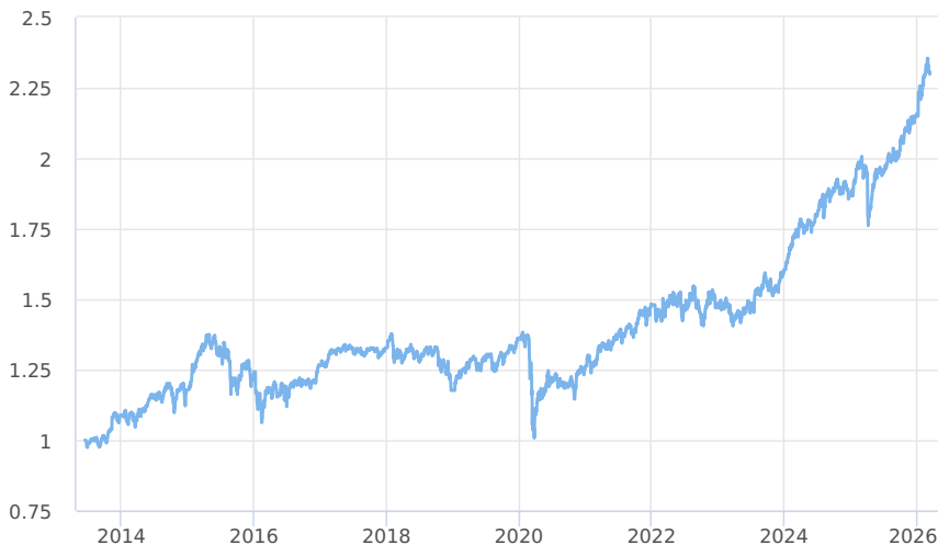
— KB Portfolio - Dividendové (třída A)