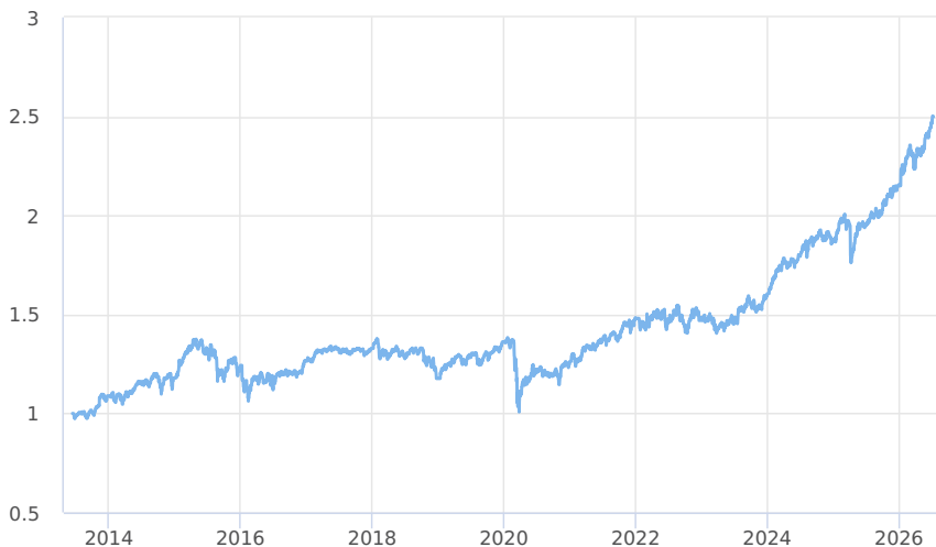
— KB Portfolio - Dividendové (třída A)