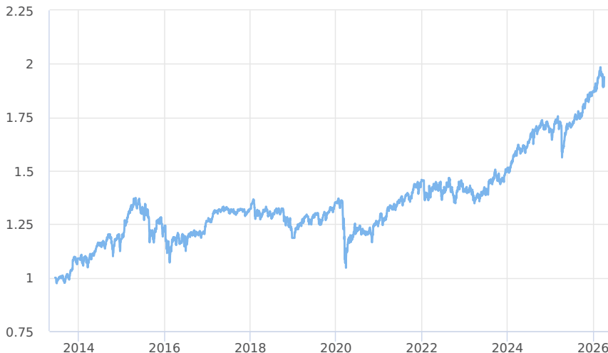
— KB Portfolio - Dividendové (třída D)