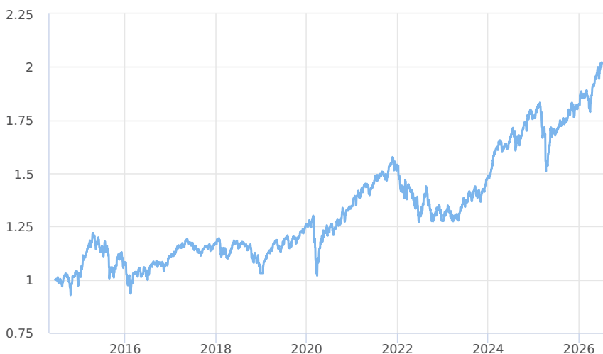
— Amundi CR All Star Selection