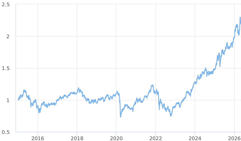
— Amundi CR Akciový - Střední a východní Evropa - třída A