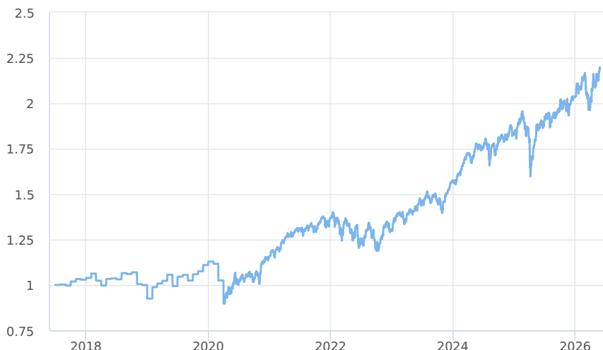
— KBPB Equity Strategy - TŘÍDA PRIVATE