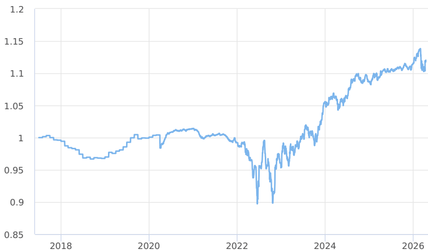
— KBPB Bond Strategy - TŘÍDA PRIVATE