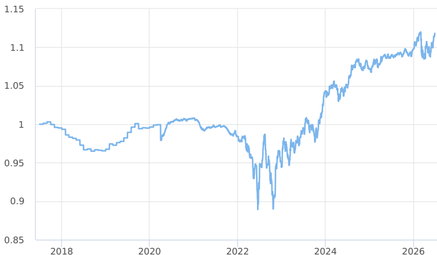
— KBPB Bond Strategy - TŘÍDA PREMIUM