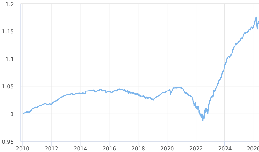
— Amundi CR - Sporokonto