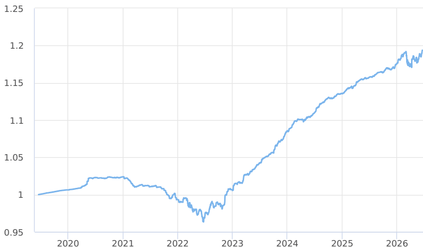
— Amundi CR Privátní fond úrokových výnosů