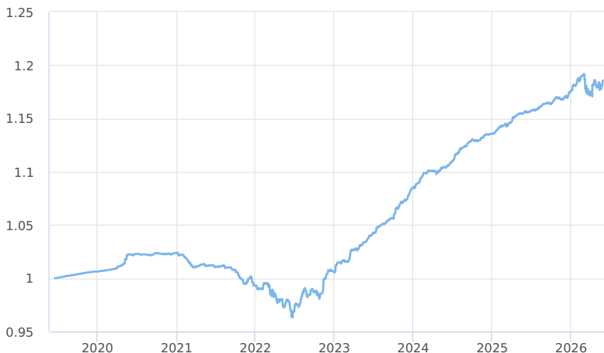
— Amundi CR Privátní fond úrokových výnosů