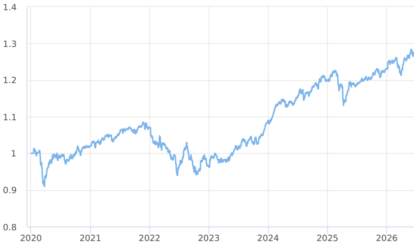
— Amundi CR Balancovaný