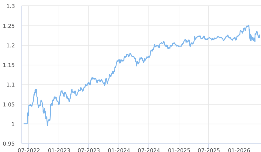
— Amundi CR - obligační fond (třída M)