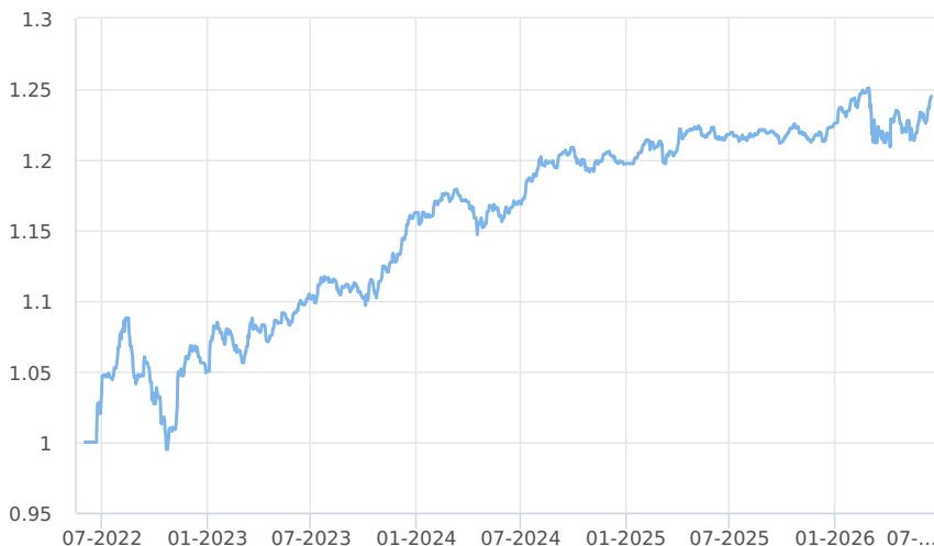
— Amundi CR - obligacni fond (trida M)