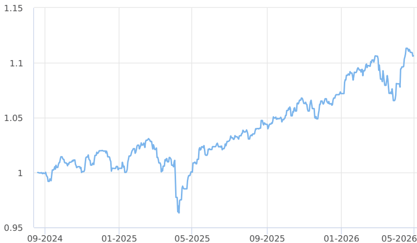
— KB Portfolio - Vyvážené