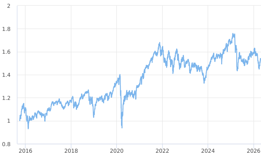
— CPR Global Silver Age