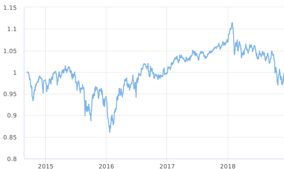
— First Eagle Amundi International Fund