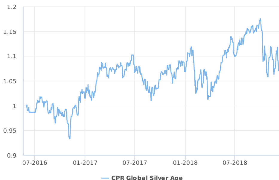
Tabulka výkonnosti k 06.12.2018